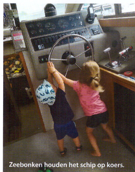
Zeebonken houden het schip op koers.

De hemel klaart op. De wind gaat liggen, de temperaturen stijgen. Onze zoon en partner arriveren met twee kleinkinderen, stoere zeebonken zijn het, ze bezetten de boot alsof ze al jaren het schip op koers houden met een kielzog zo recht als een liniaal. We varen uit. Wiegend op een rustige deining. Ik vertel geen ijselijke verhalen over afgeknelde vingers en gebroken botten in beestachtige weersomstandigheden, wel over meeuwen die ver weg vliegen en altijd terugkomen. We zijn op de juiste koers, het jongste klimbeest moeten we in de gaten houden.